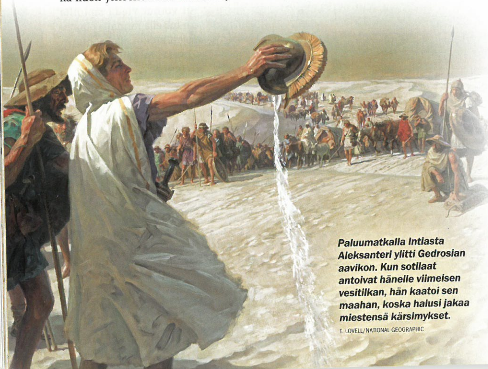
Paluumatkalla Intiasta Aleksanteri ylitti Gedrosian aavikon. Kun sotilaat antoivat hänelle viimeisen vesitilkkan, hän kaatoi sen maahan, koska halusi jakaa miestensä kärsimykset.