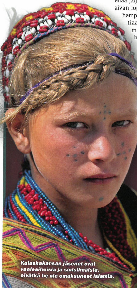
Kalashakansan jäsenet ovat vaaleaihoisia ja sinisilmäisiä, eivätkä he ole omaksuneet islamia.

HistoriaNET Ketä sotapäällikköä muistutat? Ota selvää: historianet.fi/sotapaallikko