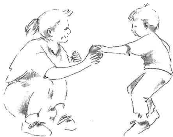
KUVA 2. TASAVERTAINEN YHDESSÄOLO.

Vanhemmat antavat ohjaavassa kasvatuksessa lapselle tämän taitojen ja voimien mukaisesti vastuuta. Lapsi saa ratkaista itseään koskevia asioita ja tehdä valintoja, kuten leikkiikö hän liukumäessä vai hiekkalaatikolla, petaako hän sänkynsä ennen aamiaista vai sen jälkeen tms.