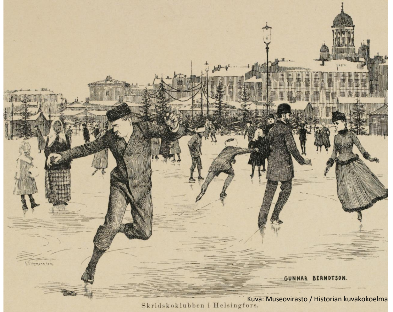
Piirros Helsingin luisteluseurasta 1800-luvun lopulta