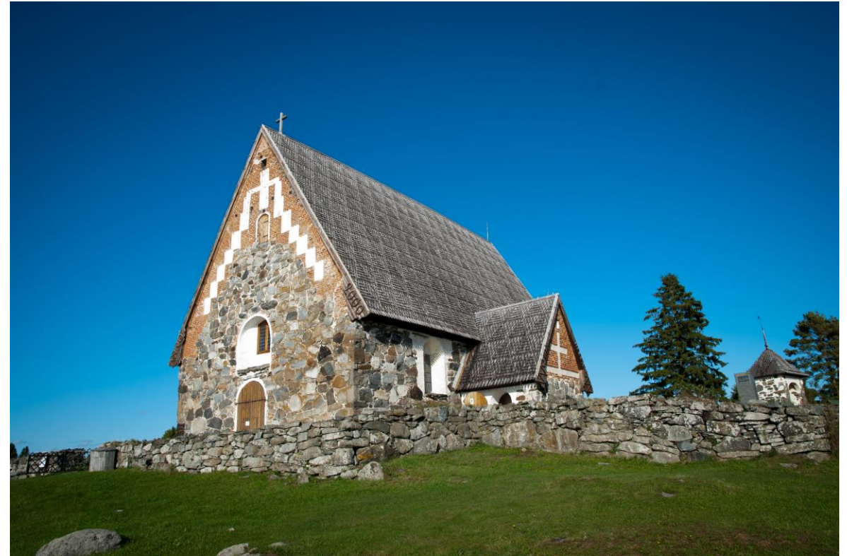
Tyrvään Pyhän Olavin kirkko Sastamalassa.