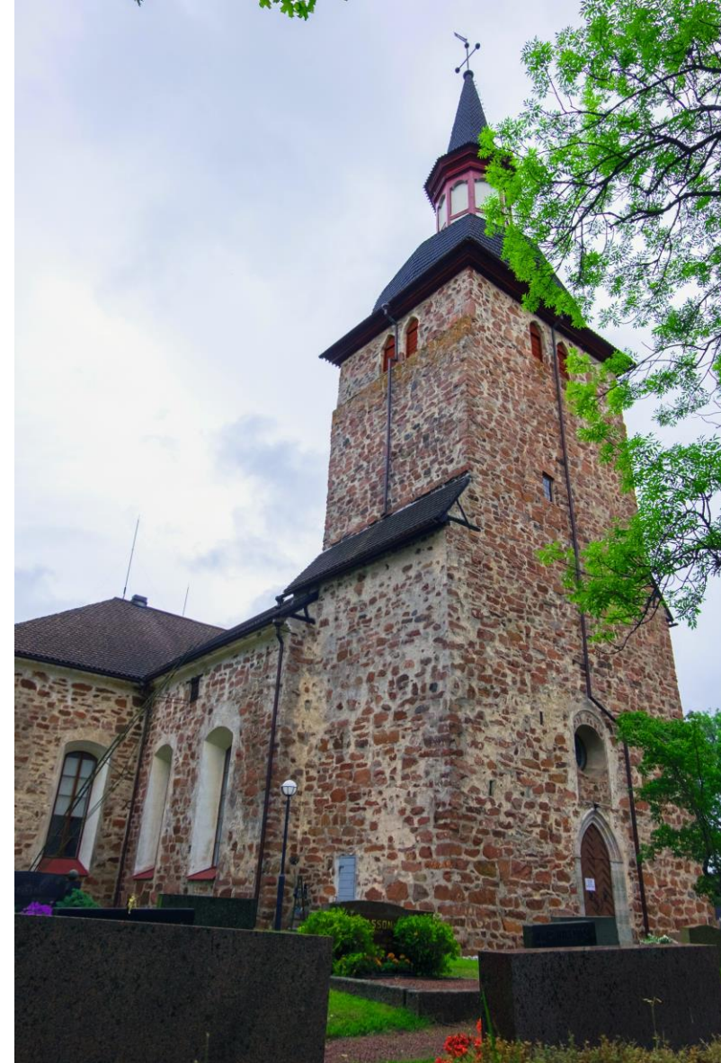
Jomalan kirkko 1200-luvulta