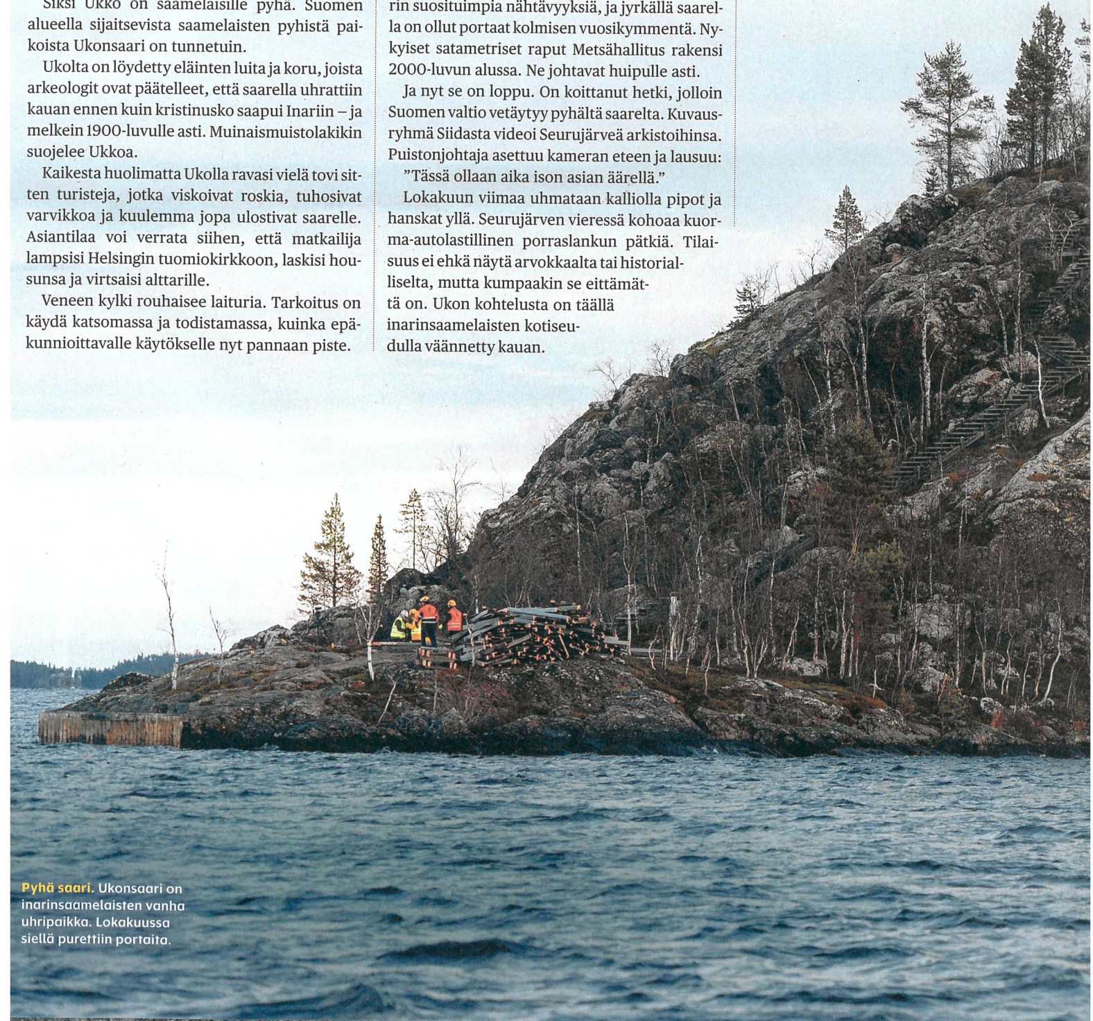
Pyhä saari. Ukonsaari on inarinsaamelaisten vanha uhripaikka. Lokakuussa siellä purettiin portaita.