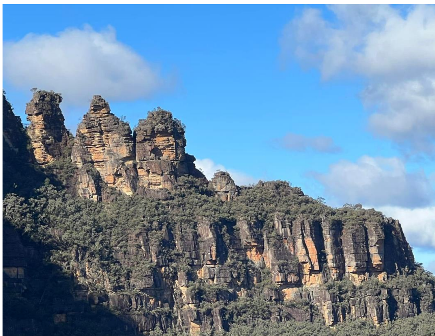
Three Sisters, Blue Mountains National Park.

Vesa Rinta-Säntti: Sunnuntaina olikin vuorossa Blue Mountains National Park. Yksi kuuluisimmista nähtävyyksistä on Three Sisters (kolme sisarusta). Siellä pääsee näkemään putouksia ja aarniometsää köysiradoilla, joita on kolme kappaletta. Kävimme luonnollisesti jokaisessa köysiradassa. Siellä on muuten maailman jyrkin kiskoköysirata. Nousukulma on 52 astetta.