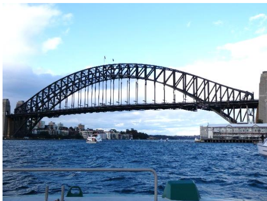
Harbour Bridge vesibussista nähtynä