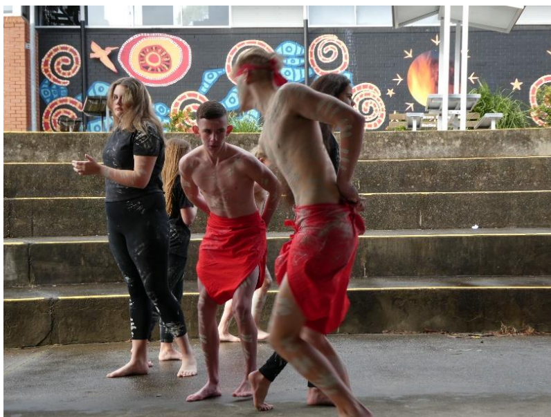
Vincentia koulun oppilaat tanssin pyörteissä viileässä aamussa.