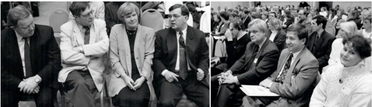
Kunnan kouluhallintovirkamiehet ry:n koulukonferenssi marraskuussa 1993 Tampereella. Presidenttipeliä ja yleisöä.

Alla kuva Opsian järjestöhistorian varrelta: