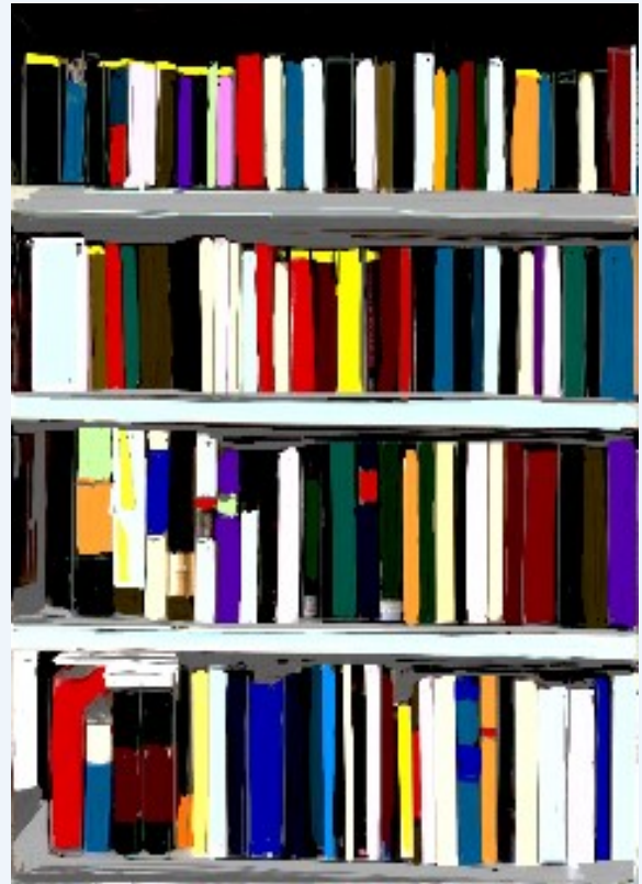
KUVITUS ANTTI LOKKA