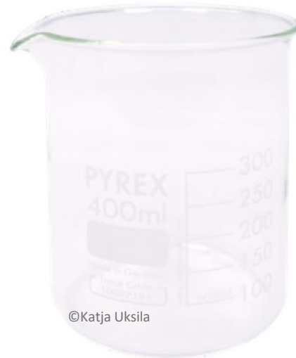
keitinlasi eli dekanterilasi