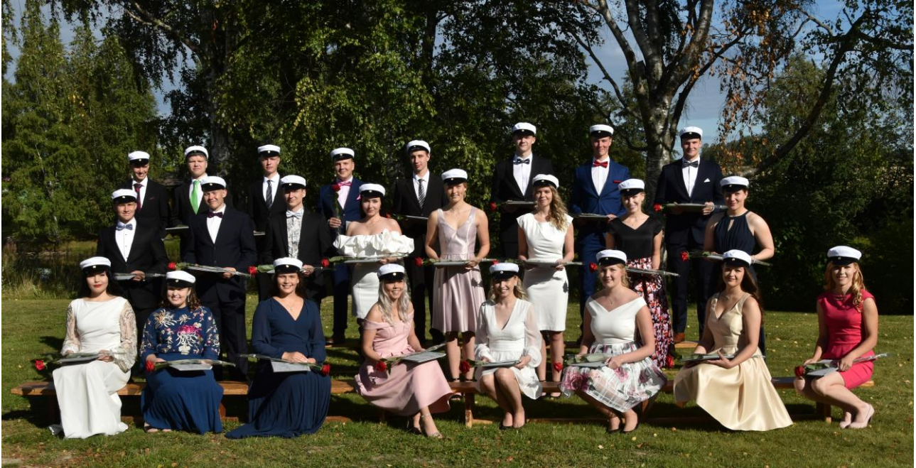
Vimpelin lukion ylioppilaat, kevät 2020