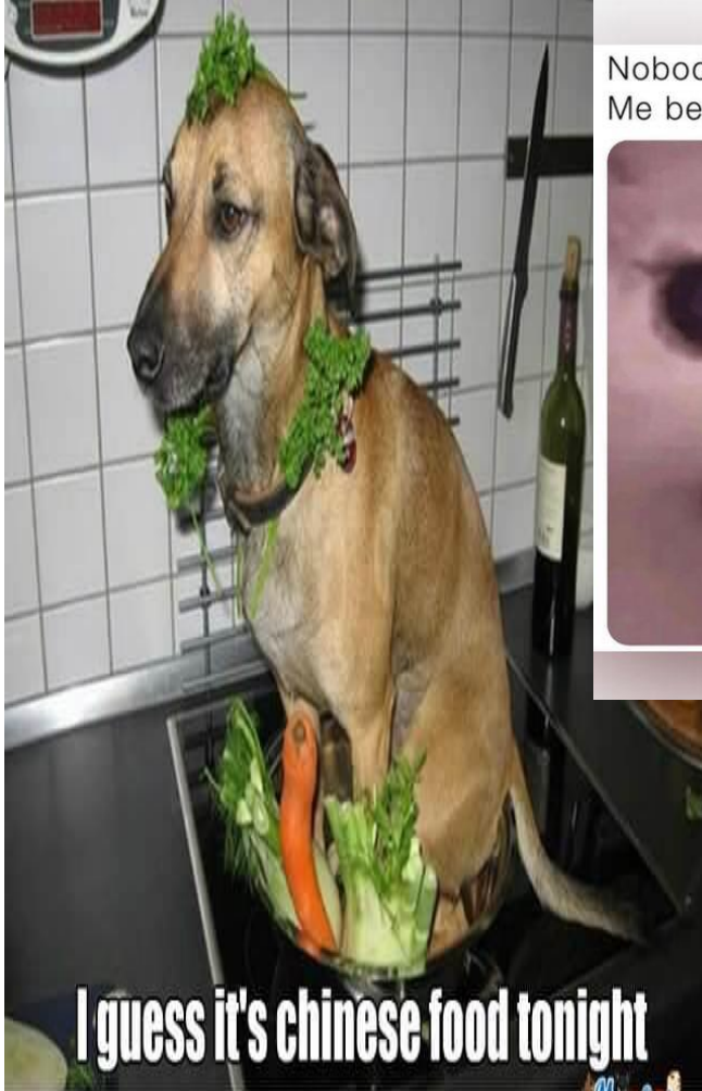
Nobody: Me because of my allergies