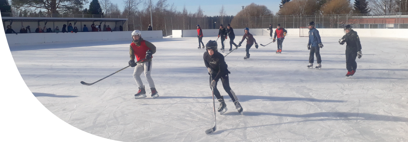
Tukareiden järjestämä jääkiekkoturnaus starttasi talviloman.