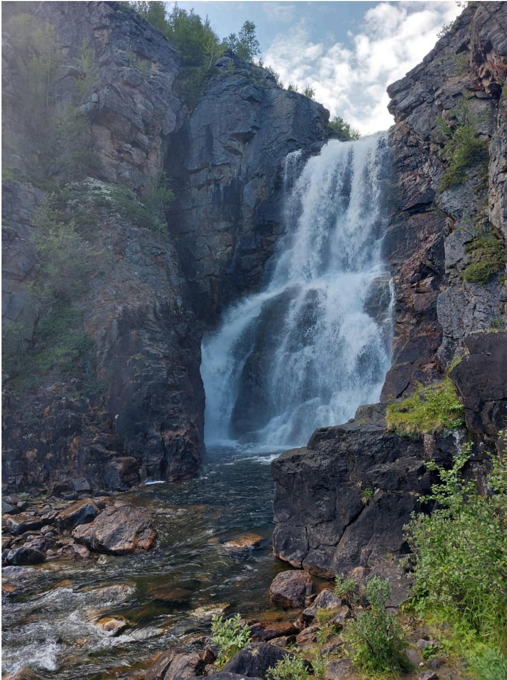
Fiellun putous on noin 26 metriä korkea.

Retkessä monelle mieleenpainuvuin hetki oli Fiellun putous, joka sijaitsi Kevon kanjonissa. Lähes kaikki opiskelijat olivat varanneet retkelle mukaan uimavaatteet, koska oli jo valmiiksi suunniteltu, että vesiputouksella käydään uimassa. Putouksen äänekkään veden kohinan kuuli jo kaukaa. Moni opiskelija kävi uimassa suuren vesiputouksen juurella. Vesi oli kyllä jäätävän kylmää, mutta se ei haitannut, koska putouksen vieressä oleminen oli niin mahtavaa. Putouksen juurella uiminen osoitti mihin luonnonvoimat pystyvät. Korkealta tippuva vesi muuttui osittain sumuksi. Tunnelmaa pystyi kuvailemaan jopa maagiseksi.