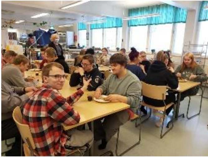
Pizzat lukuloman kunniaksi