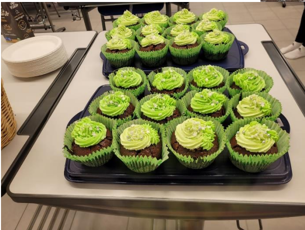
Penkkarikuvia + puolivälikahvit kakkosille