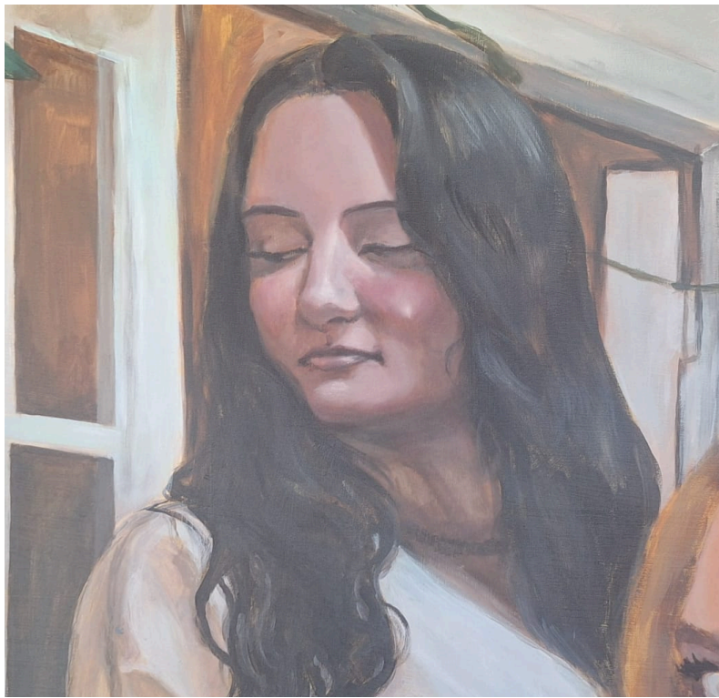
Viime hetken muutokset