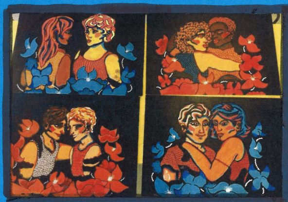
1. huhtikuuta ☆