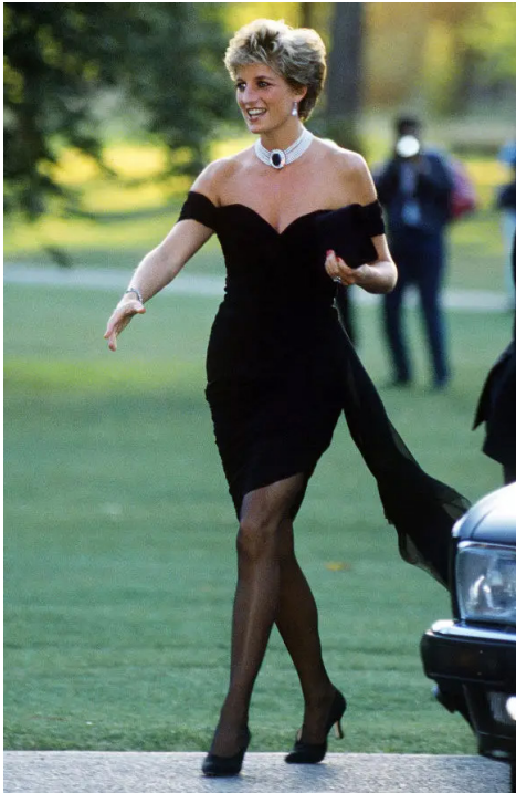
Prinsessa Dianan kuuluisa "kostomekko (revenge dress)"

Tiesin jo ennen kuin Sara Hildénin syyslukukausi alkoi, että tahdon tehdä työni digitaalisesti. Ideaa lopputyöhön ei ollut, mutta se oli minulle heti varmaa, että työ tulisi olemaan digitaalinen. Digitaalinen piirtäminen/maalaaminen alkoi minulla vahvasti 7. luokalla ja tutustutin itseni puhelimella piirtämiseen hitaasti oppien digitaalisen maalaamisen/piirtämisen salat. 9. luokalla sain oman iPadin ja se olikin ensimmäisen kokemukseni kynän kanssa piirtämisestä digitaalisella alustalla.