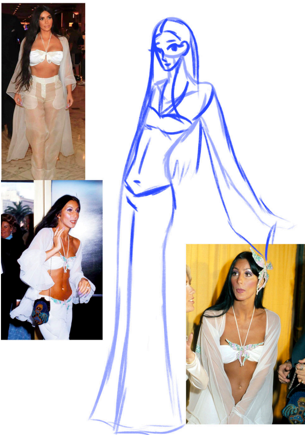
1) Ruma luonnos siitä, mitä tuleman pitää.

Mutta sitten, kun työskentelin, työskentelin pitkään ja tarmokkaasti. Sain teoksia tehdessäni "purkauksia", parin kolmen päivän tehojaksoja, jolloin saatoin saada miltei yhden työn loppuun. Se kieltämättä vei voimani sitten taas vähäksi aikaa. Piirtäminen ja taiteen luominen on minulle hyvin vaihtelevaa: välillä piirrän innoissani monta tuntia niin, että jalkani ovat lopulta melkein puutuneet, välillä en saa kynää nostettua tai suutun, kun piirtämäni asia ei onnistukkaan niin kuin olisin halunnut. Taiteen tekeminen vaikuttaa myös sen takia vahvasti mielialaani.