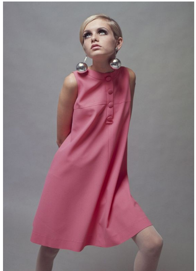
Teokseeni ottama Twiggyyn asu