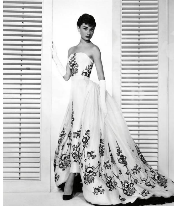
Audrey Hepburnin ikoninen asu Kaunis Sabrina -elokuvasta

Tahdoin panostaa asuihin ja niiden yksityiskohtiin tehden niille kunniaa. Yritin samalla poistua mukavuusalueeltani piirtäen vaatteita, sillä ne ovat usein heikkouteni ja yleensä välttelen monimutkaisia asuja parhaani mukaan. Halusin haastaa itseäni myös tekemällä useamman kuin pari teosta, joten päädyin viiteen. Tavoitteenani oli tehdä niistä mahdollisimman yhtenäiseltä näyttävä sarja, mutta samalla tehdä jokainen niistä yksitellen, että ne pärjäisivät myös yksilöinä.