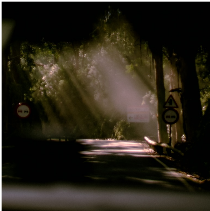
Kuva 2. Korostin koko kuvassa vihreitä sävyjä, mikä antoi kuvalle satumaisen tunnelman.

Tavoitteena oli luoda kuvakirja joka herättäisi lukijassa tunteita ja ajatuksia hetkestä. Kuvaparien ideana on pysäyttää katsoja vertailemaan kuvia ja niiden kuva-aiheita. Kuvapareista voi huomata samoja muotoja, värejä tai vastavärejä, tunnelman samankaltaisuuden tai nopeasti ohi menneen hetken. Nämä