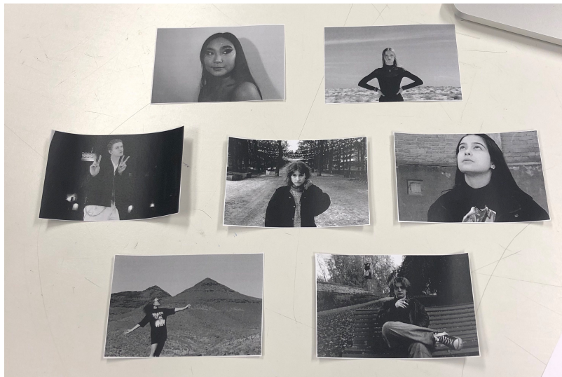
Kuvat tulostettuna ennen niiden lähtöä teetettäväksi.

Kultaisilla kehyksillä haluan viestiä voimaa. Jokainen meistä on kullan arvoinen omine piirteinemme ja tapoinemme.