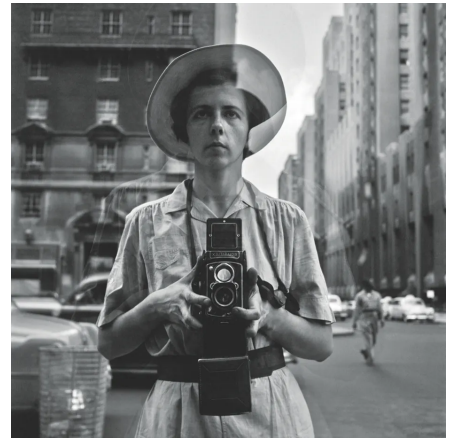
Kuva: Vivian Maier

Vivian Maier (1926-2009) oli yhdysvaltalainen lastenhoitoja, jonka kuvaamat persoonalliset valokuvat löytyivät sattumalta vasta hänen kuolemansa jälkeen. Maier kuvasi tavallisia, tuntemattomia ihmisiä kadulla, lapsia leikeissään ja itseään peilikuvan kautta.