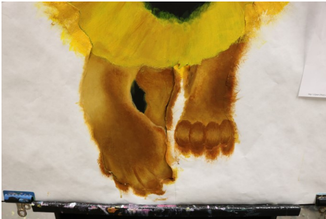
Kuva 6: Tassujen maalaus