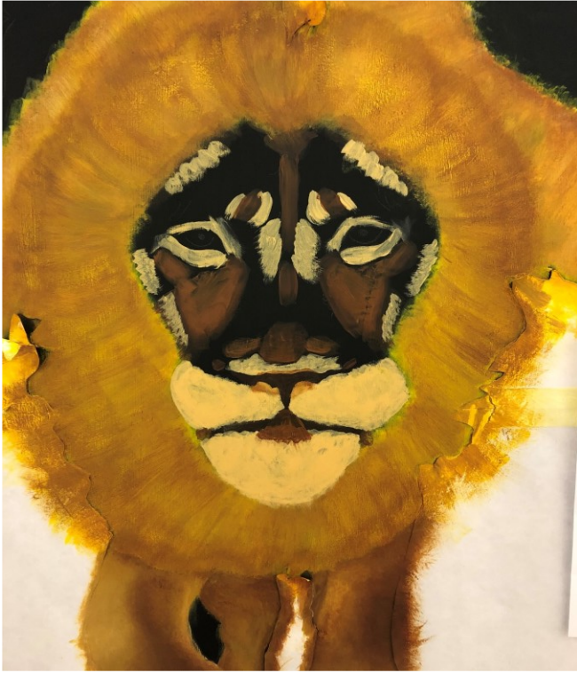
Kuva 5: Keskimmäisen leijonan kasvat työn alla