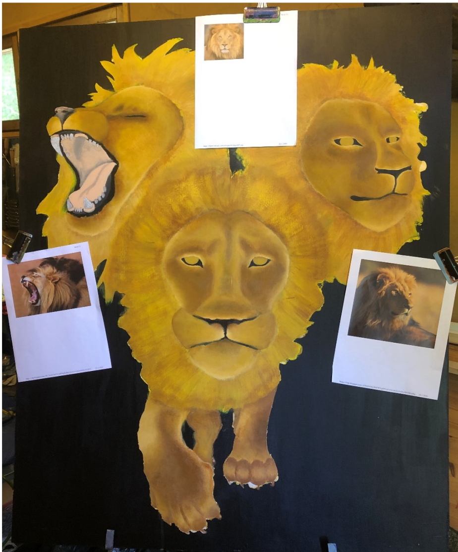
Kuva 1: Keskenäinen teos mallikuvineen

aihe oli niin henkilökohtainen. Halusin tutkia suhdettani leijona aiheeseen ja pysähtyä kunnolla miettimään sen merkitystä minulle.