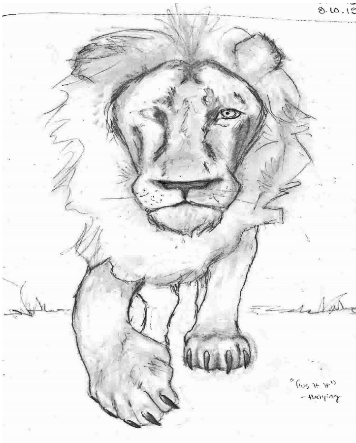
Kuva 2: Alkuperäisen suunnitelman mukainen luonnos

Ajatus siitä, että leijonia olisi useampi oli työpäiväkirjamerkinnöistäni päätellen hautunut jo jonkin aikaa ennen kuin 30.10.19 innostuin asiasta todella ja piirsin lopullisen teoksen ensimmäisen luonnoksen. Se osoittautui niin hyväksi, että päädyin lopulta käyttämään sitä tehdessäni sapluunaa maalausta varten. Aiemman suunnitelman mukainen, erityisen hyvin onnistunut luonnos ei kuitenkaan mennyt hukkaan. Se itseasiassa toimi pohjana, johon vain lisäsin kaksi muuta leijonan päätä. Se päätyi sellaisenaan lopullisen sapluunan malliksi.