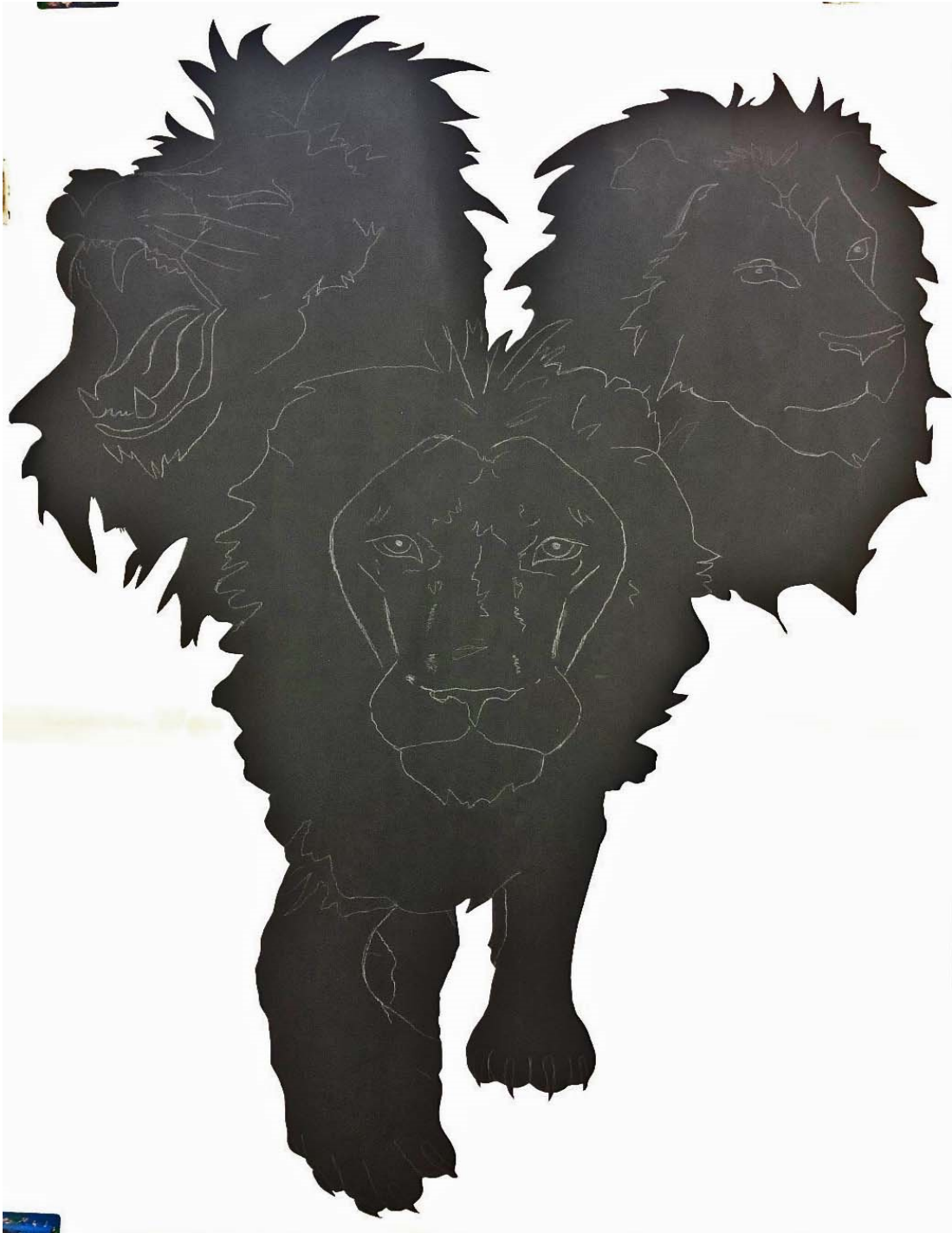
Kuva 4: Sapluuna