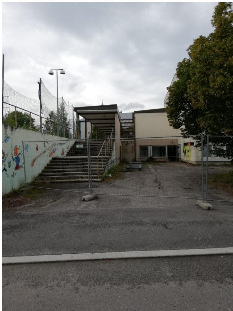
Vanha yhteiskoulu ennen