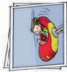
in an amusement park