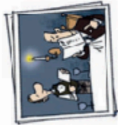
in a restaurant