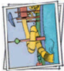
in a water park