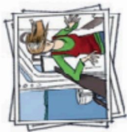
on a ferry