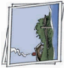
at a summer cottage