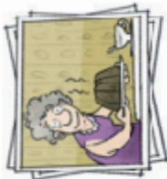
at my granny's