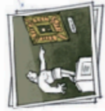
at a museum