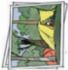
at a camp