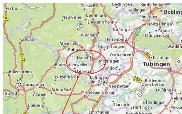
Nagold sijaitsee lähellä Tübingeniä, 51 km Stuttgartista etelään.