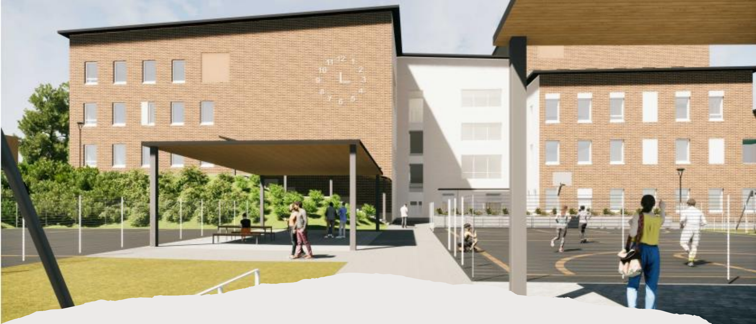
Ahmon uusi koulukeskus