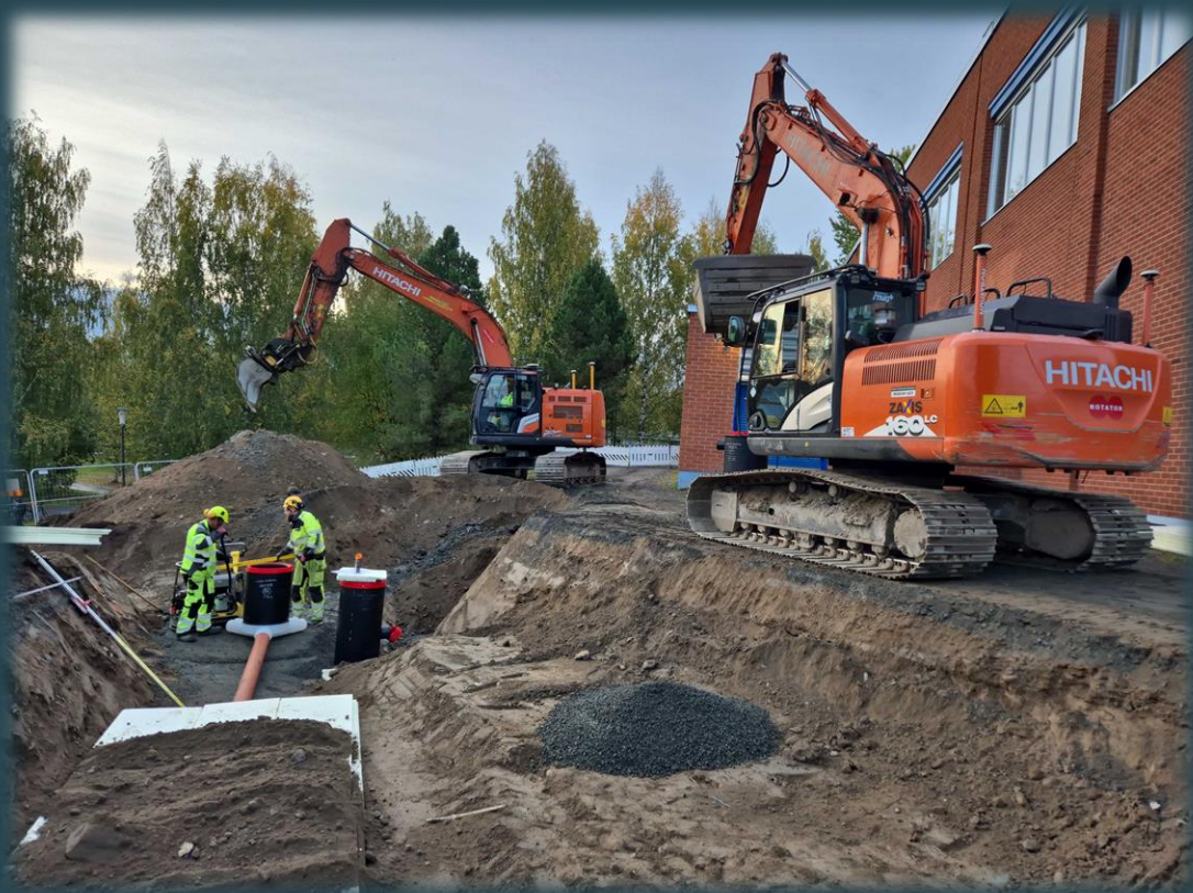
Hulevesiviemärin ja kaivojen asennus