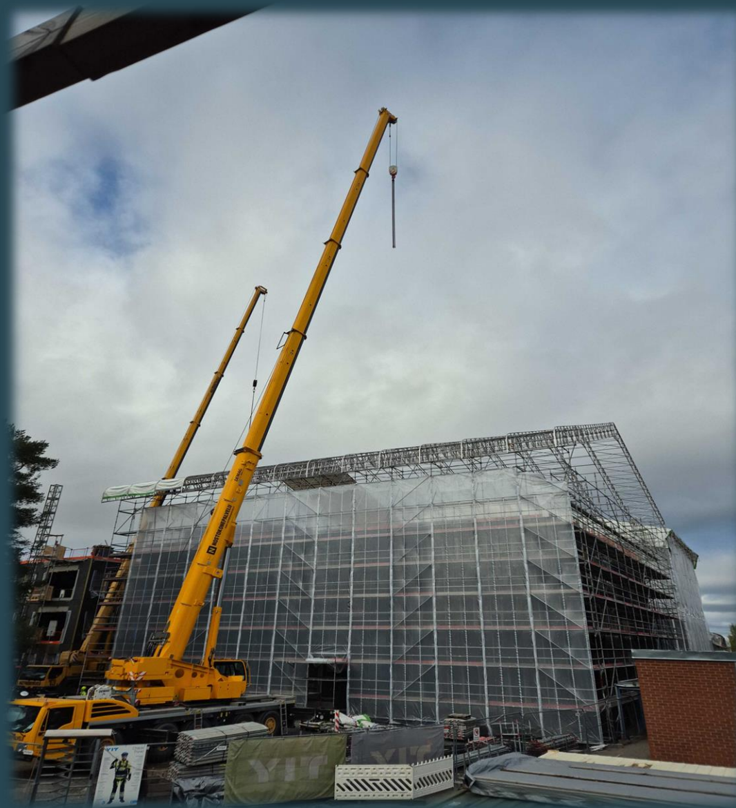
B-lohko sääsuojan asennus