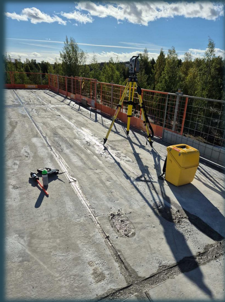
”TÄKYMETRI”, mittamiehen mittalaitteisto