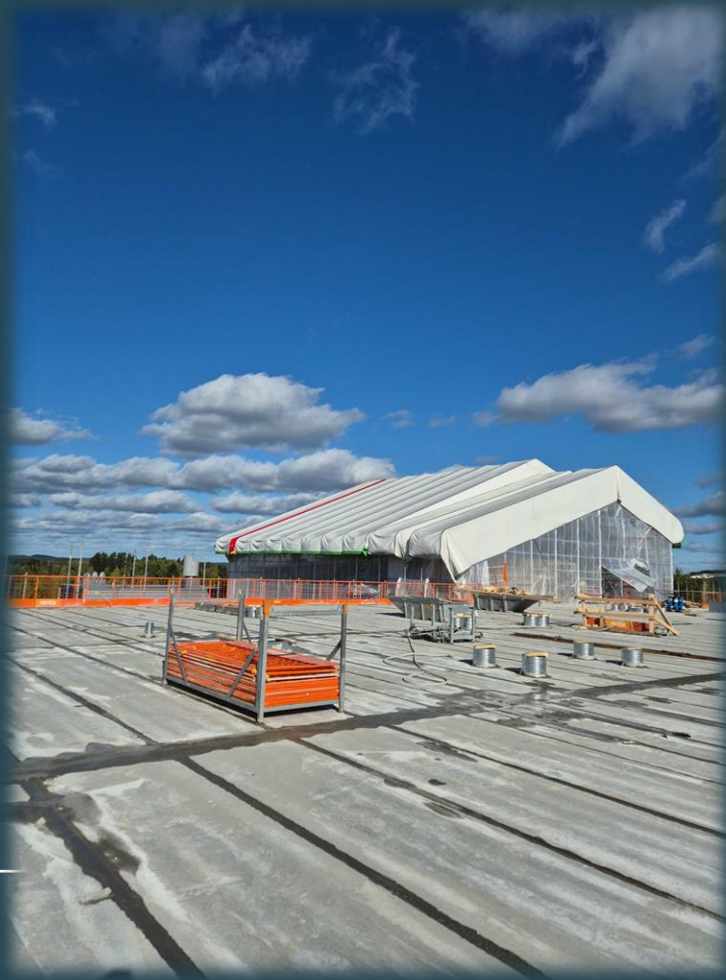
Viimeinen ontelokenttä valmis