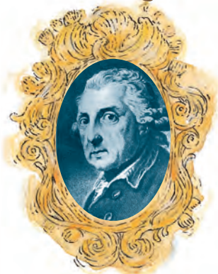
Friedrich der Große (1712–1786), König von Preußen