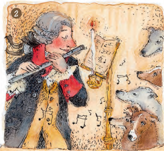
In dem Schloss wohnt Friedrich der Große. Er ist König von Preußen. Der König spielt gerne Flöte. Und er mag Hunde. Er hat viele Windhunde.

3 Die Frage ist aber: Mögen auch die Hunde das Flötenspiel?