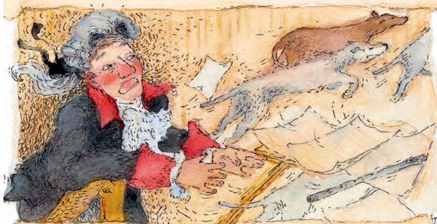
Friedrich der Große: Oh je!

3 Die Frage ist aber: Mögen auch die Hunde das Flötenspiel?