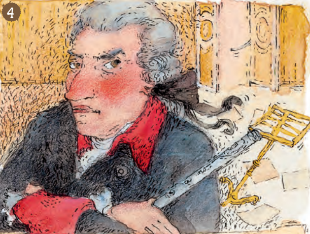
Friedrich der Große: Das Schloss heißt jetzt Ohne Hunde !