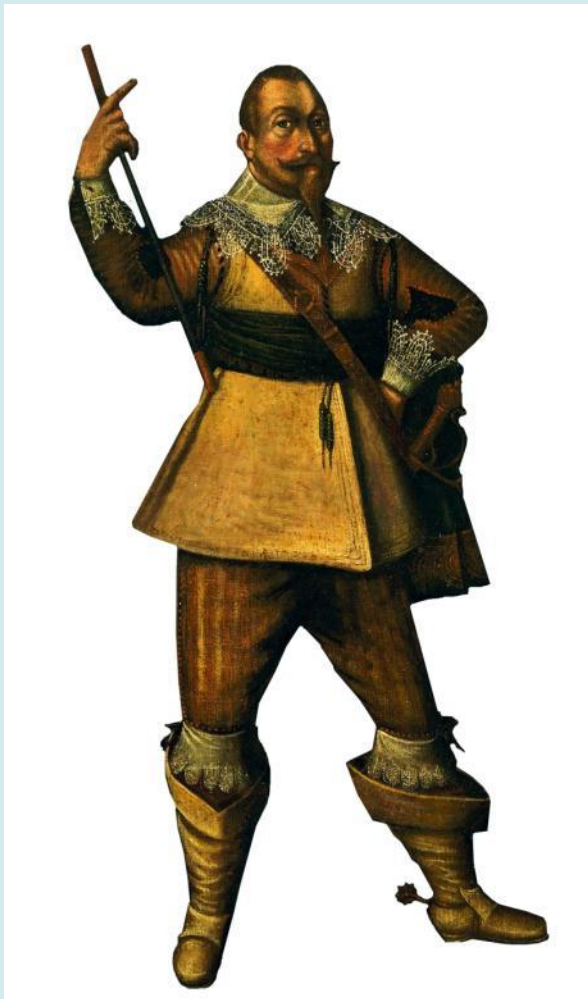
Kustaa II Aadolf