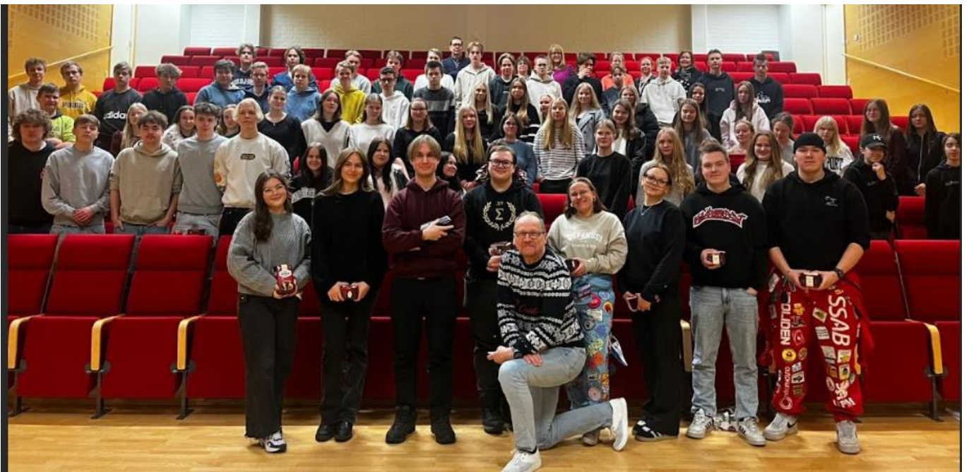
Alumnipäivänä joulukuussa lukion entiset opiskelijat kertoivat omista jatko-opinto- ja työelämäkuvioistaan.