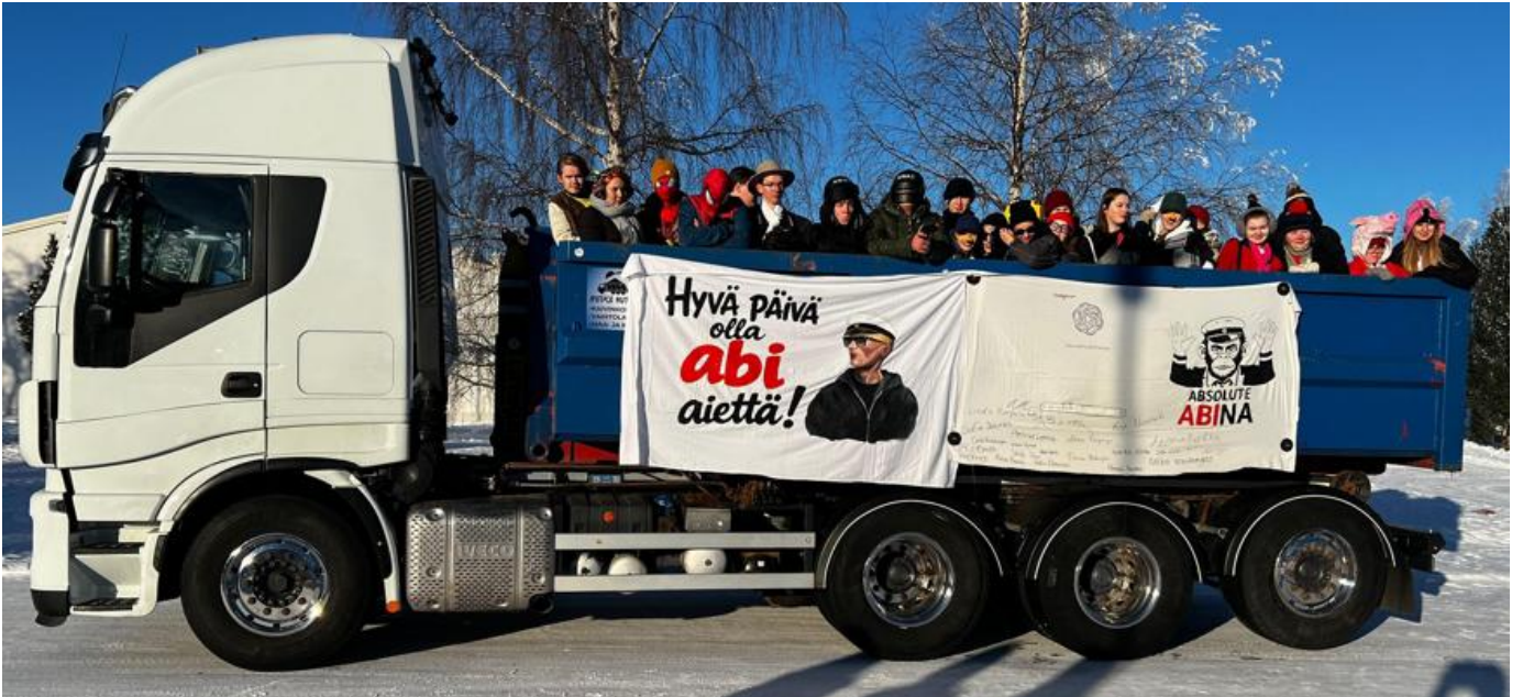
Abiturientit lähdössä perinteiselle penkkaripäivän ajelulle, mukana 80-luvun abi valvojana.