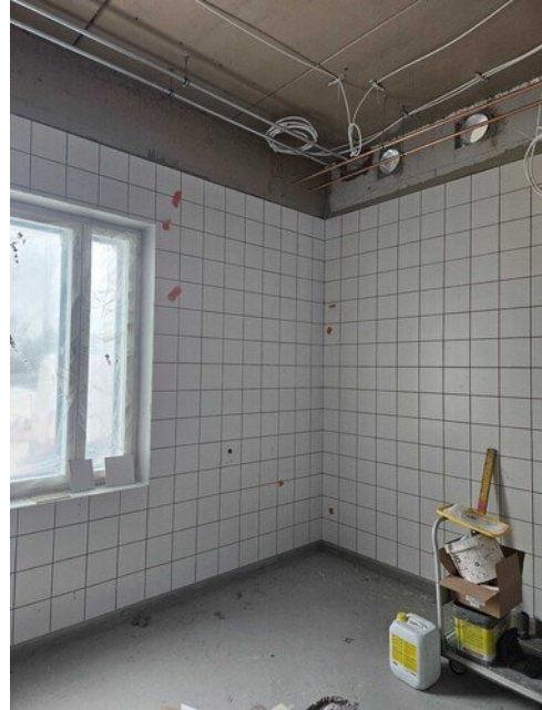
Siivouskeskuksen seinät laatoitettu