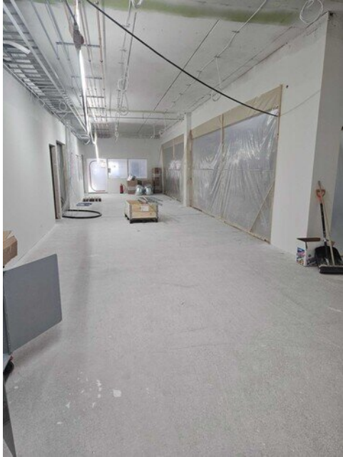
P1 alue 2 tarkastettu ja valmiina maanantaina alkavaan iv-kanavien asennuksiin