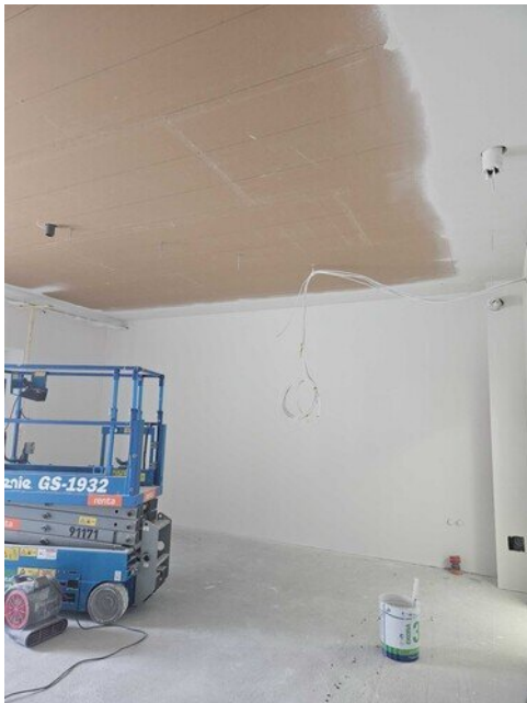
Musiikkiluokan seinät tasoitettu ja pohjamaalattu