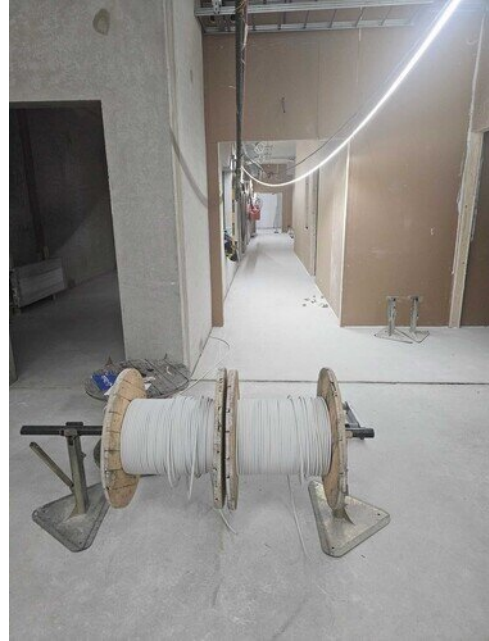
Sähköjohdotukset menossa myös 2. kerroksessa