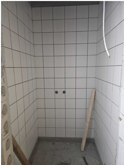
Laatoitus saumausta vaille valmis henkilökunnan pukutiloissa