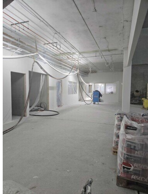
Alakerran aula tasoitettu ja pohjamaalattu