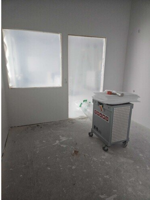
Ilmanpuhdistimella työnnetään puhdasta ilmaa, eli ylipaineistetaan iv-asennusalue