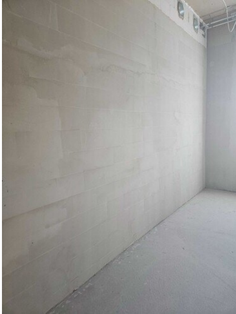
Vesieristys ja laatoitus mestaa