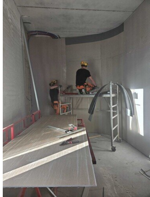
Timpurit vaihtanut huonetta viikon aikana