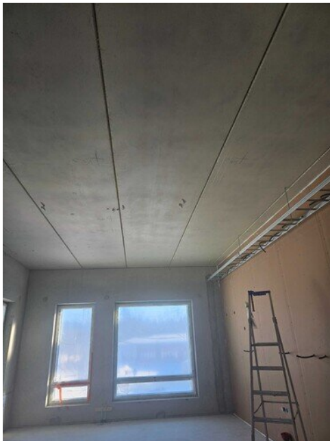
Sähköri asentanut lokinsiipiä valmiiksi johtoasennuksia varten