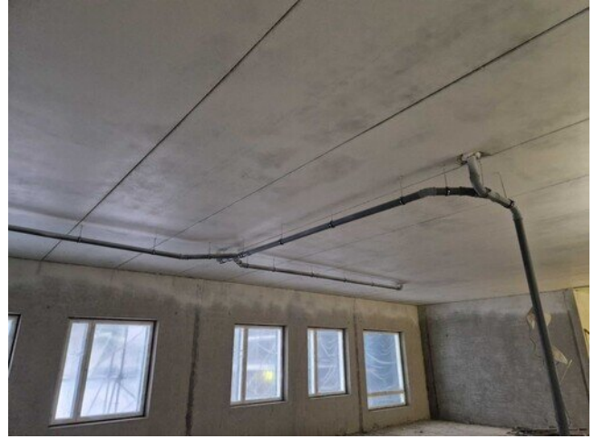
2. kerroksessa tehty viemärihajoituksia ja pölynsidontamaalausta.