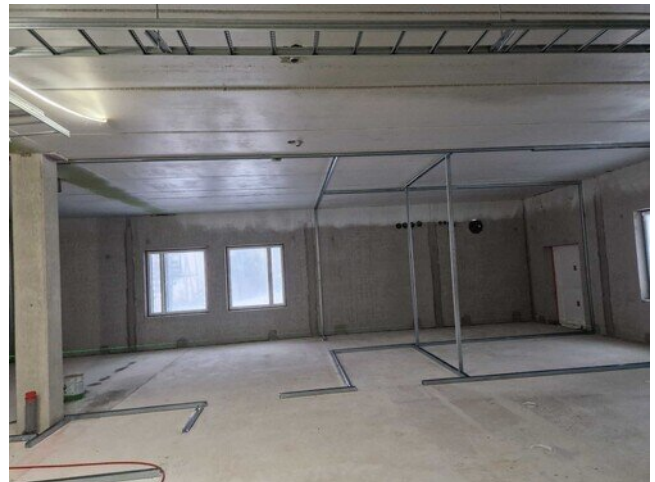
1.kerroksessa pölynsidonta tehty ja väliseinien teko alkanut.