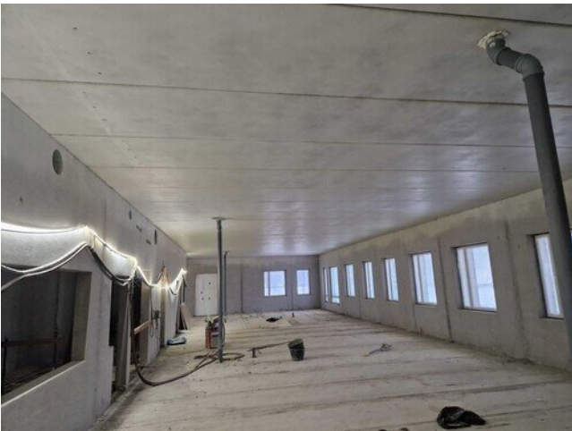
2.kerroksessa pintalattiavalun valmisteluja menoillaan.