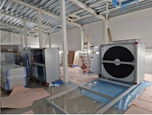
IVKH:ssa iv- koneet nostettu konehuoneeseen ja TK25 asennus alkanut.