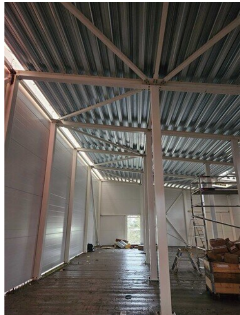
Iv-konehuoneen kantavat kattopellit asennettu