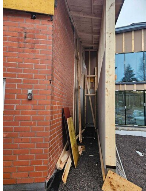
Vanhan puolen uuteen iv-konehuoneeseen kulku tulee olemaan tästä