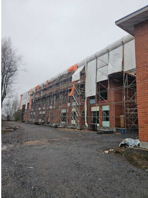
Sääsuoja takapihalta päin