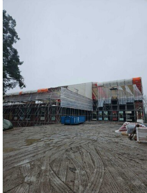
Sääsuoja yläpihalta päin