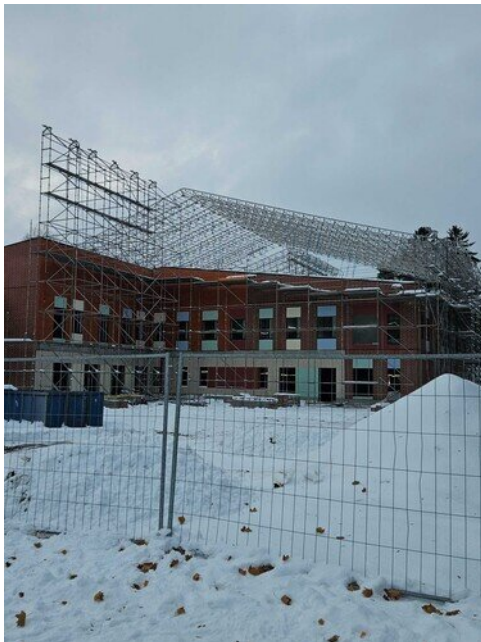
Sääsuojan korkeus hahmottuu tästä kuvasta parhaiten