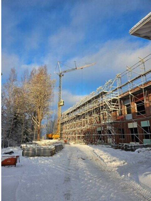
Ensimmäiset kattoristikot nousee sääsuojarungon päälle.