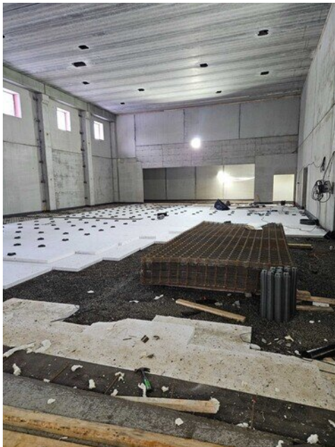
Liikuntasali valetaan torstaina