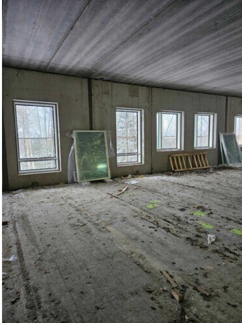
Ikkunoita asennettu 2 kerroksessa