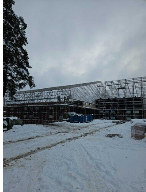
Sääsuojan runkoa yläpihalta päin