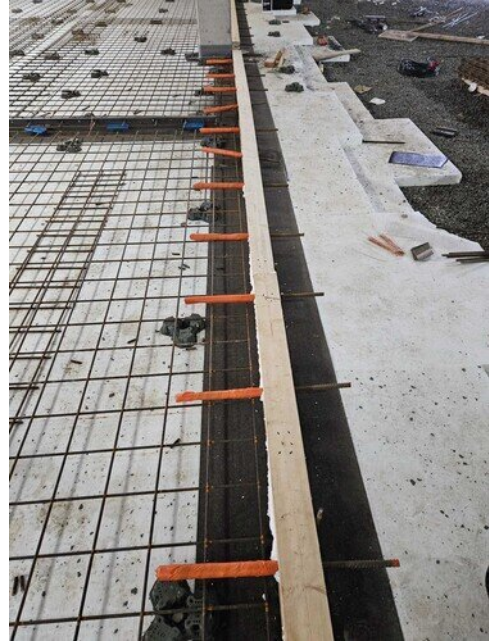
Akustinen liikuntasäuma tulossa tähän aulan ja liikuntasalin välille