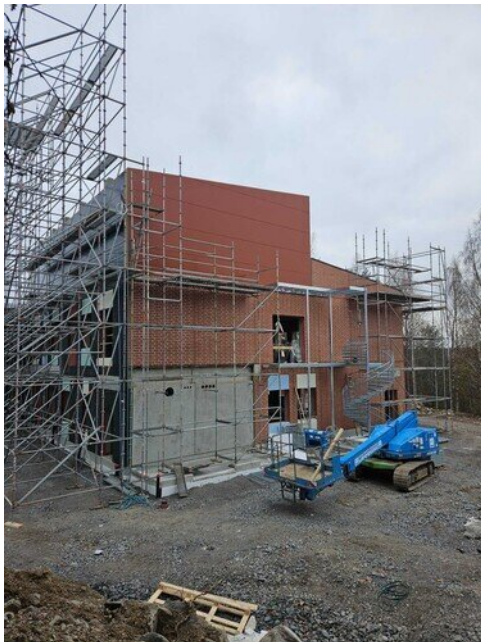
Kierreporras iv-konehuoneeseen melkein kasattu