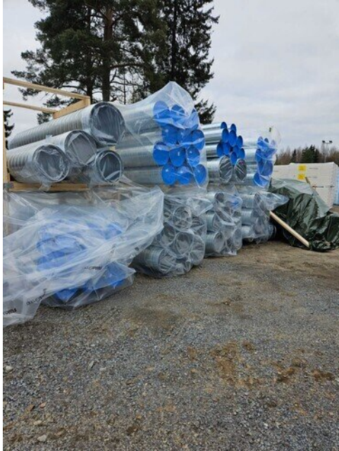
IV-kanavat saapuneet työmaalle