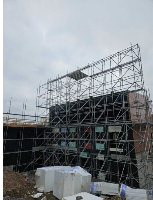
Aika korkea sääsuoja tulee