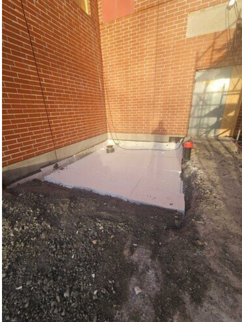
Hätäpoistumisportaiden anturan pohja valmiina