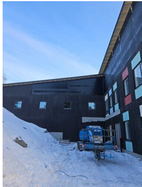
Parocit saatiin asennettua ulkoseinään kun saatiin sääsuoja pois tieltä