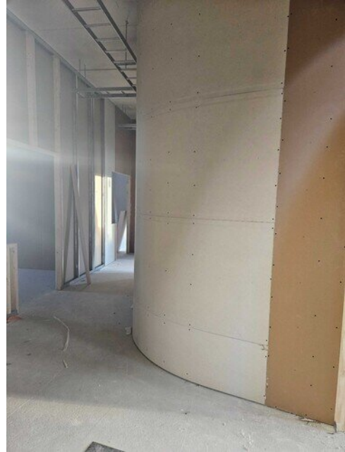
Kaarevaakin seinää löytyy 2 kerroksesta