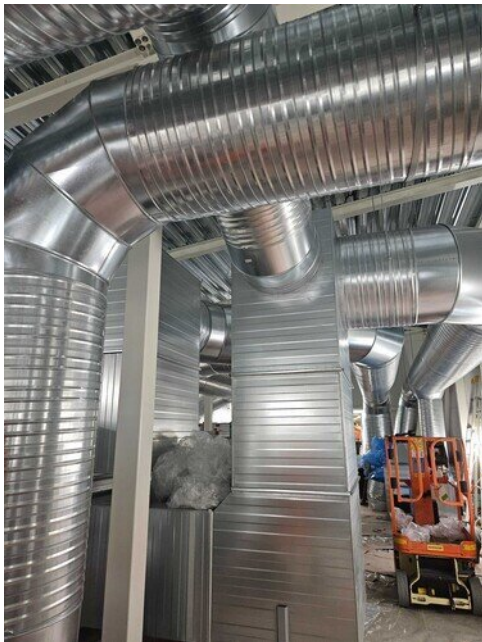
IV-konehuone alkaa täyttymään, vielä puuttuu sähköt sekä lämpö- ja vesiputket