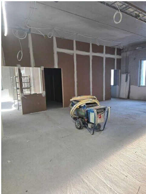
Teknisentyön siipi nauhoitettu ja maanantaina alkaa ruiskutukset