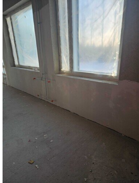
Patterin taustat tasoitettu 1 kerroksessa