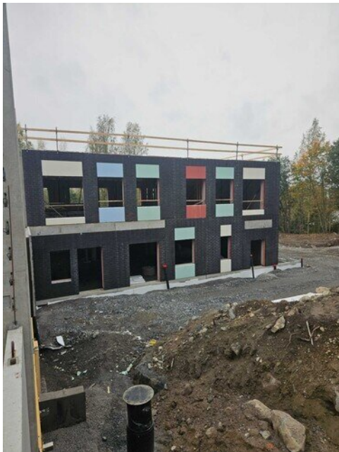
Teknisentyön siiven seinävärit