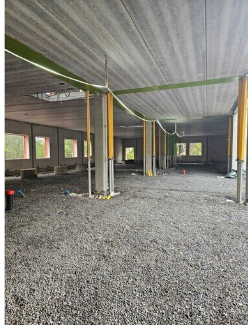
1 kerros samasta kohtaa, jouluvalot asennettu