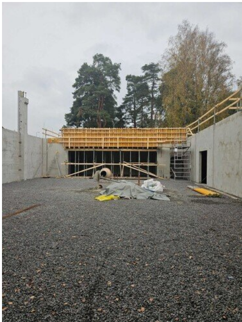
Liikuntasalin päässä paikalla valettu seinä