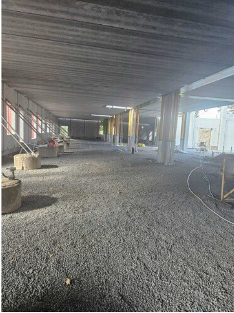
1 kerroksen näkymät kotitalousluokasta eteen päin