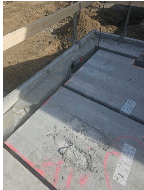
Elementtien väliaikainen suojaus ylhäältä päin