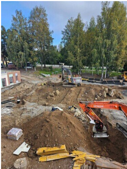
Sadevesiviemäreiden asennus etupihalle