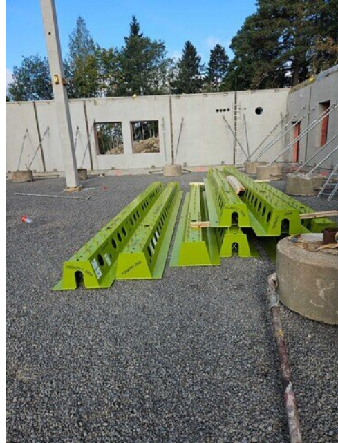
Käärijän vihreät Deltapalkit odottavat asennusta