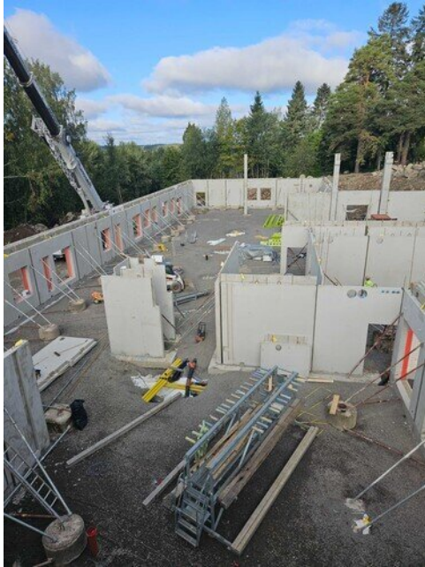
Yleiskuva aulaan ja teknisentyön luokkiin päin