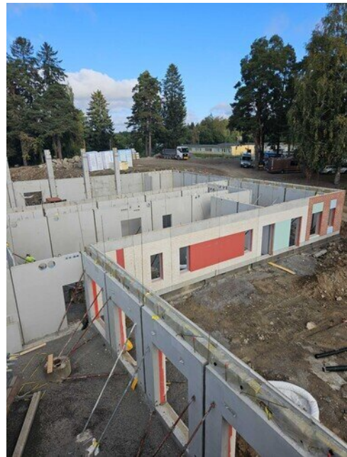
Yleiskuva liikuntasalisiipeen päin