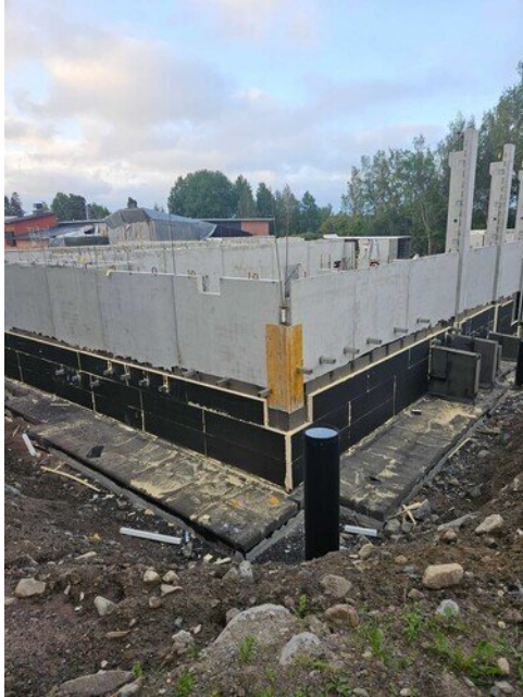
Yleiskuva saattoparkista liikuntasalin nurkalle