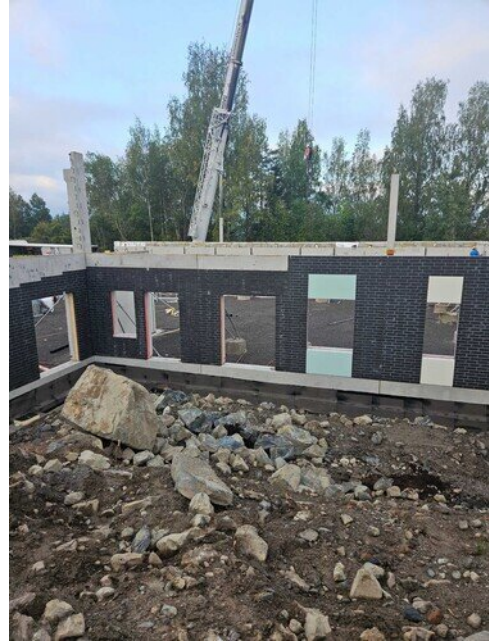
Liikuntasalin ja teknisentyön suunnittelun ulko-ovien paikat