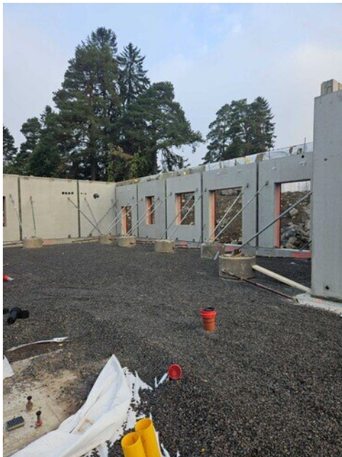
Teknisentyön luokkaa sisältä päin