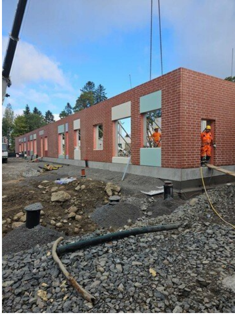
Takapihan sisäänkäynnin vasemmalta puolelta kuva