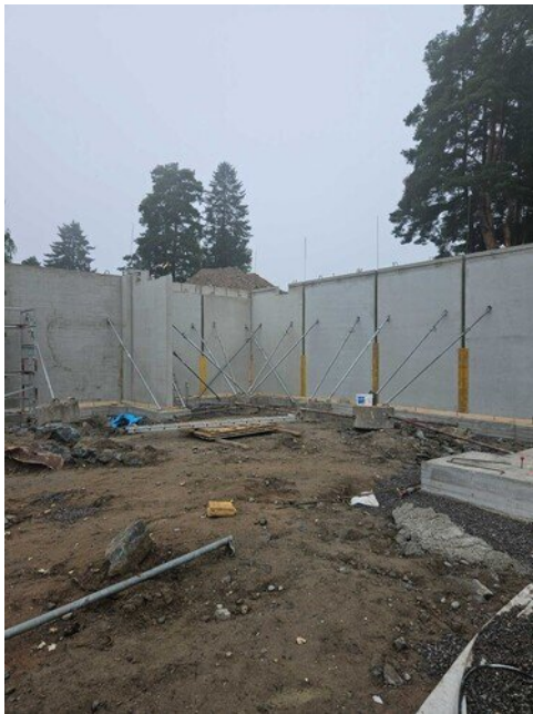
Liikuntasalin/näyttämön seinää pystyssä