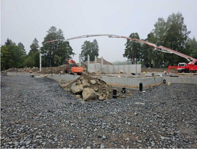
Isolla pumpulla juotosvalua