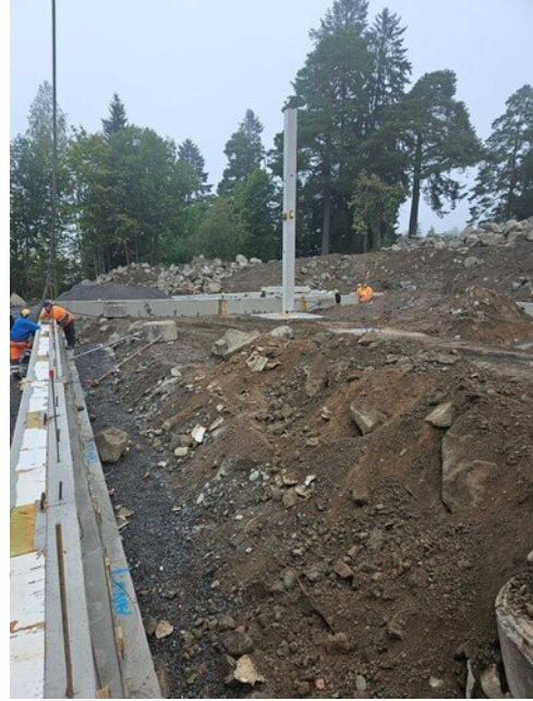
Teknisentyön luokan kohta