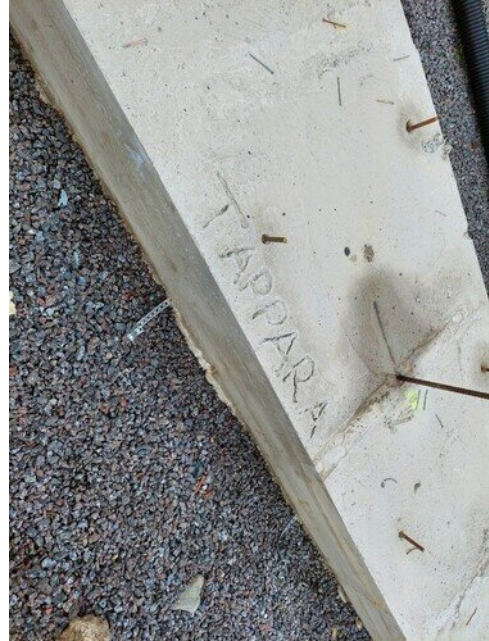
Jälkihoito epäonnistunut □