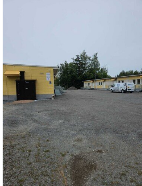
Väistötiloilla viimeiset lukitukset teon alla