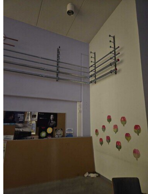
Vanhan osan alueen uusia putkia