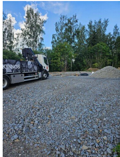
Kopit tulevat maanantaina paikoilleen