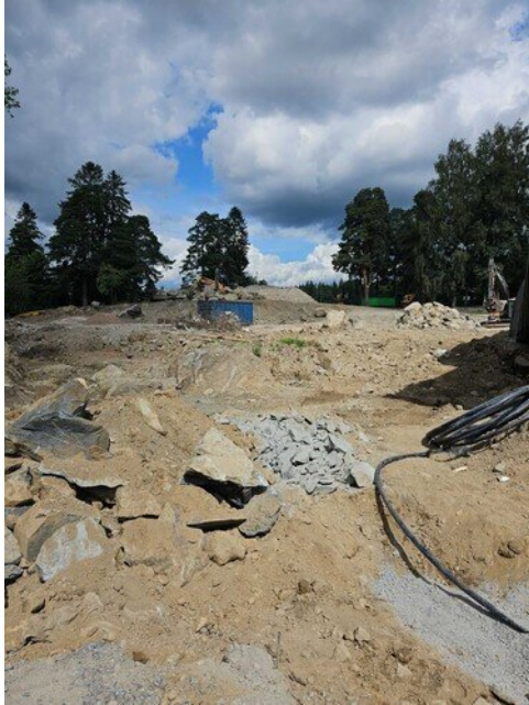
Koulu purettu kokonaan