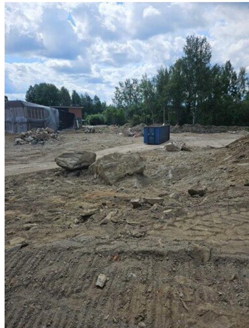
Rinnettä leikattu, isoja kiviä tullut vastaan