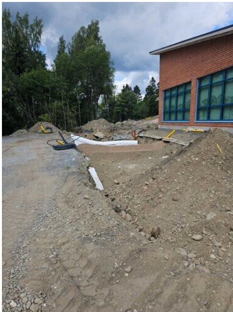
Takapihan huoltotien täyttö menossa