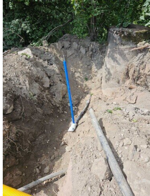
Vesijohtoon lisätty sulku, taustalla purettava jätevesikaivo