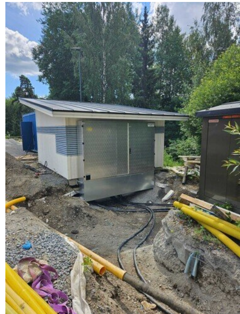
Uusi pääkeskus paikoillaan