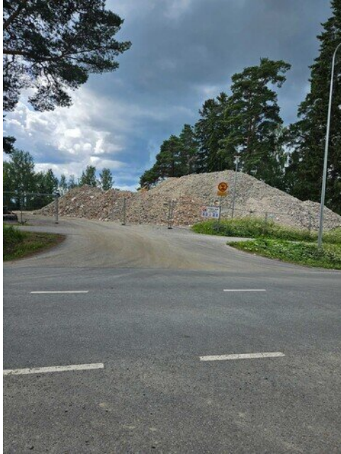
Betonimurske odottaa siirtoa loppusijoitus paikkaan