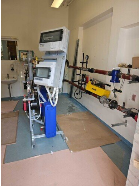
Lämmönvaihtimessa kiertää lämmin vesi