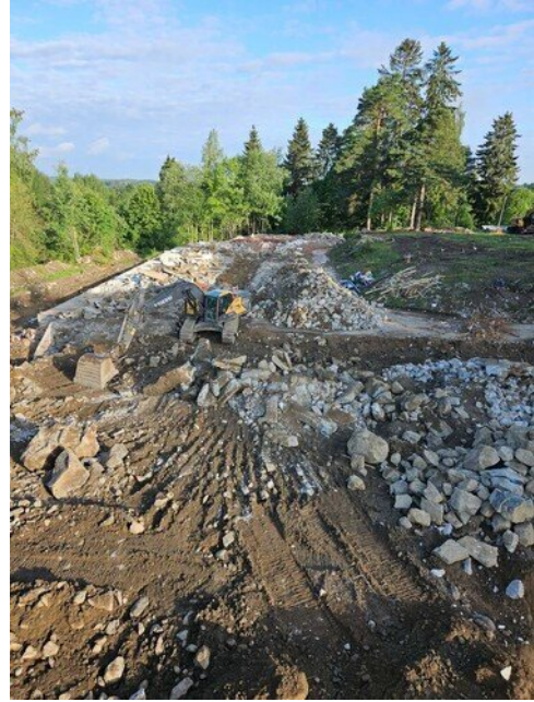
Koko rakennus purettu maantasalle