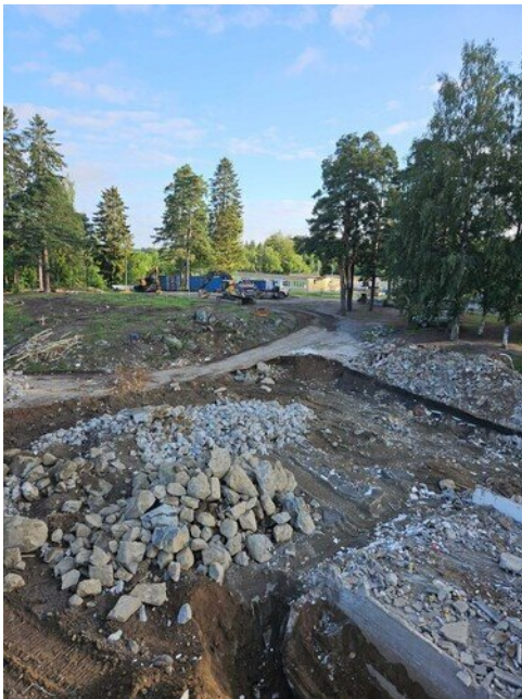
Yleiskuva yläpihalle päin