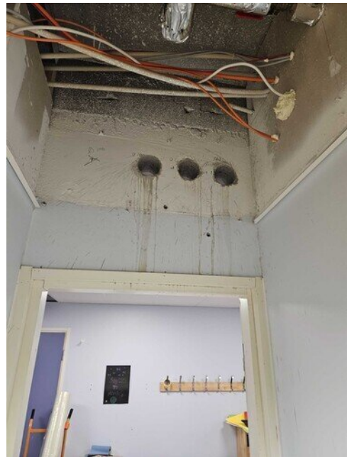
Reikiä tehty uusille vesilinjoille