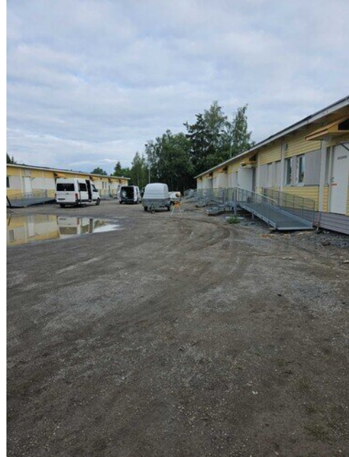
Pihaan vielä kivituhka ja pihakaivoista suojat pois