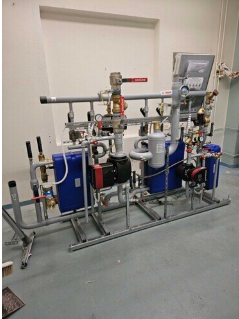
Uuden osan lämmönjakopaketti asennukset vanhassa terkkarin tilassa