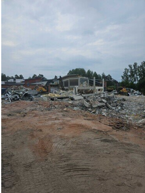
Jäävä osa näkyvässä, pressut odottaa katolla valmiina peittelyyn