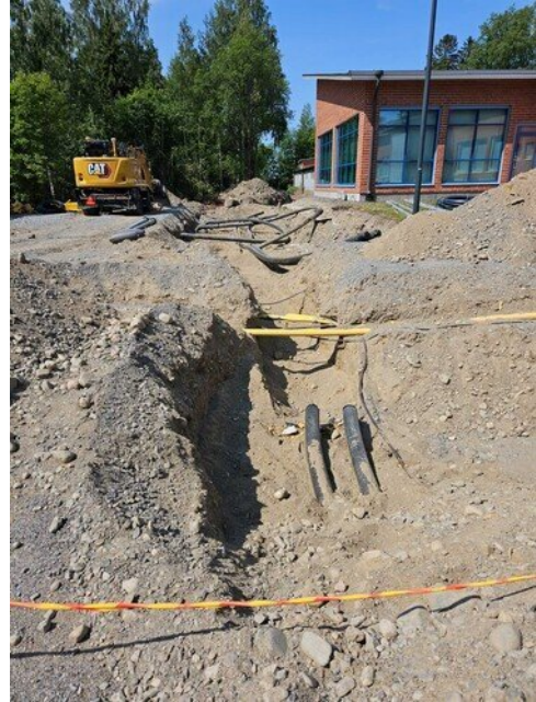
Takapihan kaivantoa huoltotietä varten