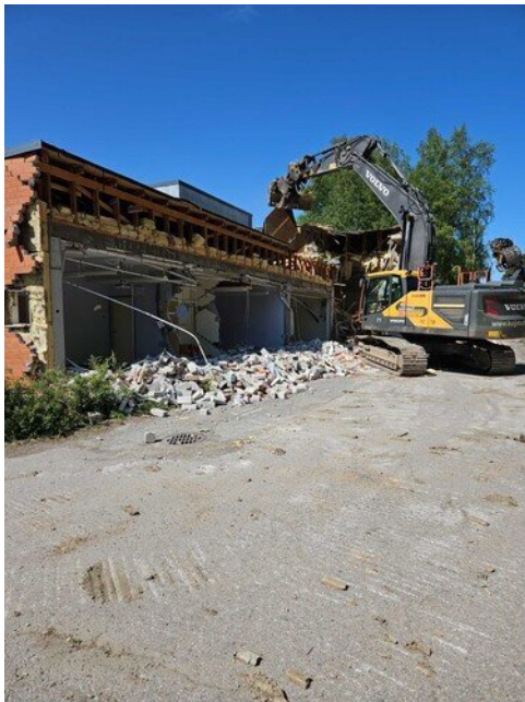
Purkutyöt liikuntasalin kulmalla