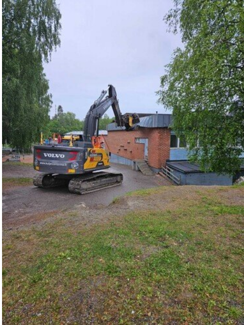
Tästä kotitalousluokan päästä purku alkoi torstai- aamuna