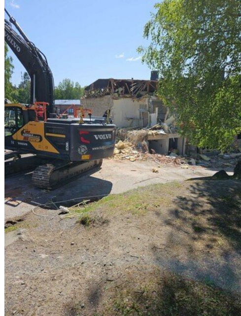
Kotitalousluokan kulma perjantaina