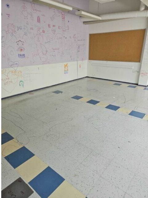
Luokat tyhjennetty asbestipurkuja varten