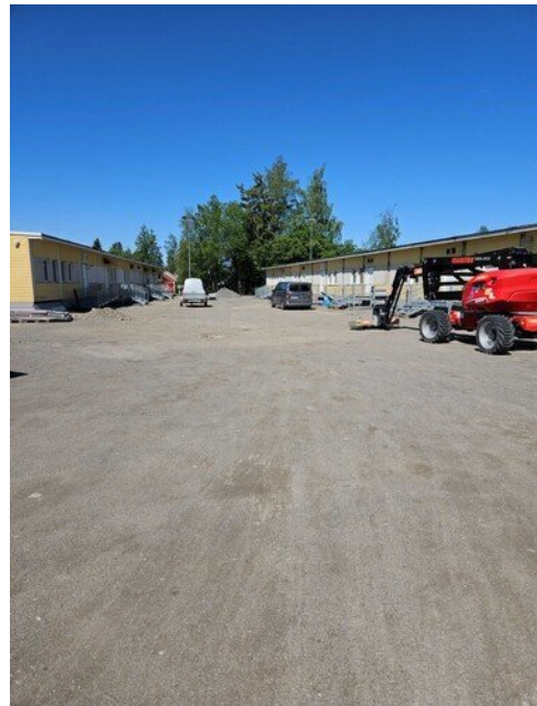
Sisäänkulkupuortaat ja luiskat on asennettu väistötiloilla