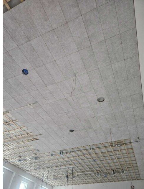
Liikuntasalin katon levytystä