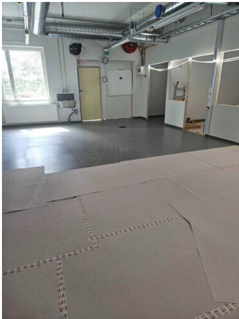
Teknisyyden luokka, vain mopoauto puuttuu