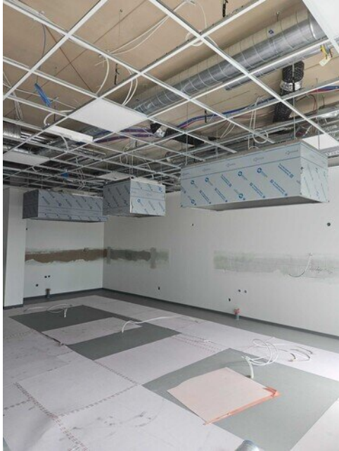
Kotitalousluokan huuvat asennettu